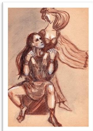
11. «Час покаяния», тонированная бумага, сепия, уголь